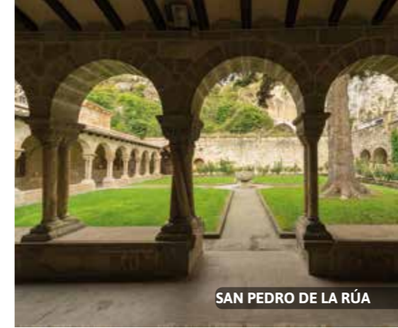
SAN PEDRO DE LA RÚA