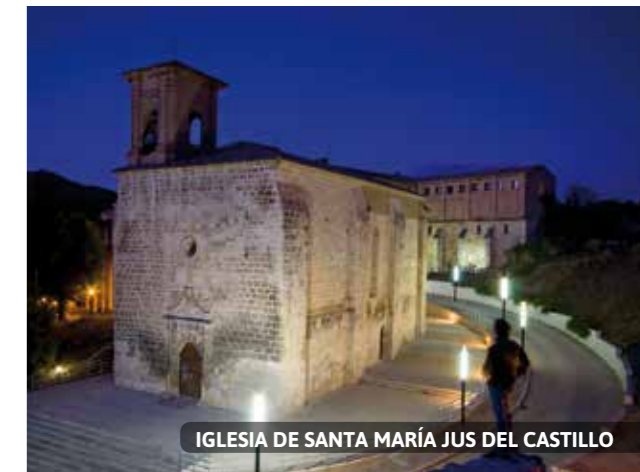
IGLESIA DE SANTA MARÍA JUS DEL CASTILLO

Los jueves hay mercado de fruta y verdura. El 2º sábado de cada mes hay mercado matinal de productores locales.