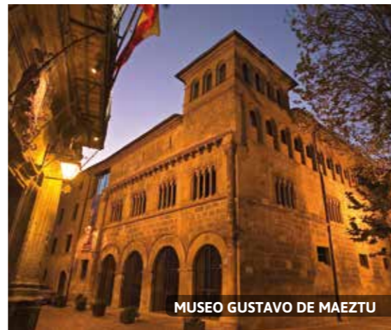
MUSEO GUSTAVO DE MAEZTU