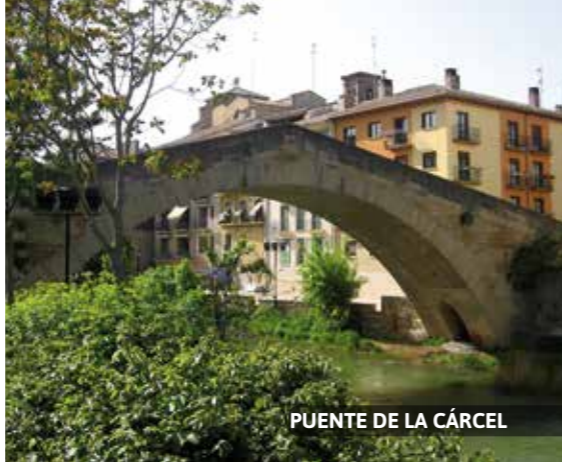
PUENTE DE LA CÁRCEL

En cualquier época del año se pueden elegir unos succulentos pimientos del piquillo ; se utilizan rellenos de carne o pescado, solos como acompañamiento de carnes o bien en ensalada como entrante. Revueltos de setas en temporada (de finales de septiembre a finales de noviembre). Hongos, también de temporada que se toman en revuelto o al horno al ajillo. Cordero al chilindrón (cordero, pimientos rojos, cebolla y ajo). El "ajoarriero" (bacalao desecado con pimiento, cebolla, ajo y tomate). Alubias pochas en temporada (finales de agosto a octubre).