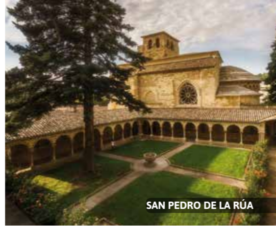
SAN PEDRO DE LA RÚA