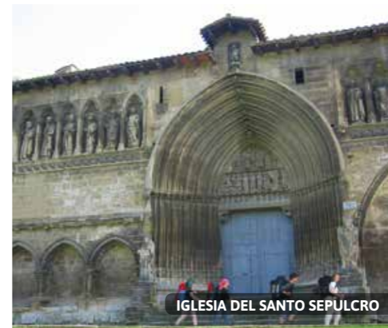
IGLESIA DEL SANTO SEPULCRO