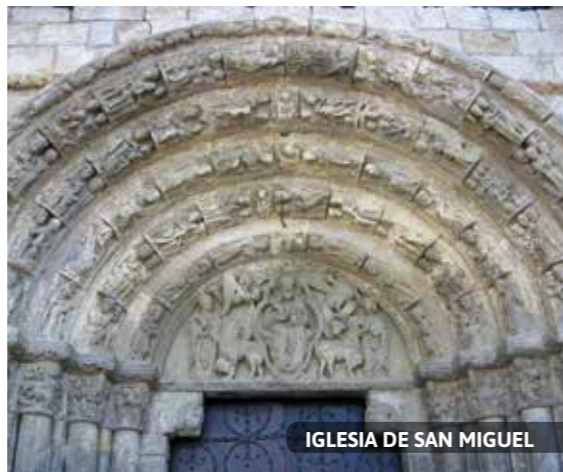
IGLESIA DE SAN MIGUEL

13. PLAZA DE LOS FUEROS . Constituye el punto de reunión de la ciudad. La construcción de la plaza actual se debe al arquitecto estellés Patxi Mangado a finales del siglo XX.