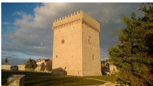
EXTERIOR DE LA TORRE