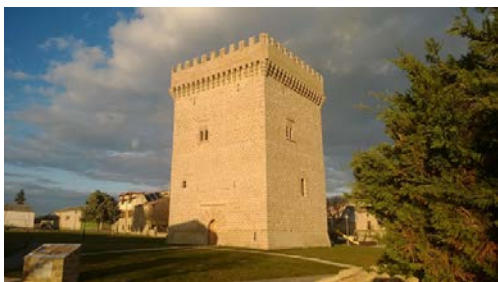
EXTERIOR DE LA TORRE