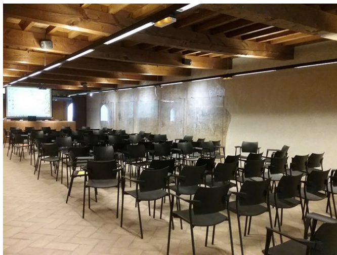
Sala de conferencias