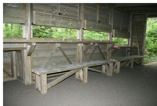
OBSERVATORIO DE AVES