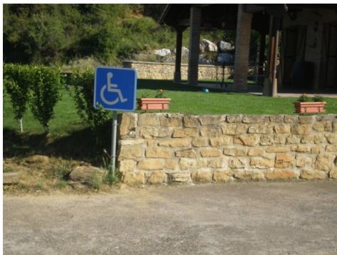
PARKING RESERVADO A PMR