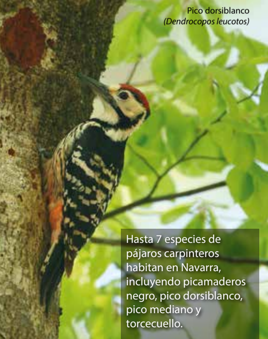
Pico dorsiblanco ( Dendrocopos leucotos )

Una de las mejores poblaciones ibéricas de avetoro común se halla en los humedales de Navarra, donde también habitan pato colorado, somormujo cuellnegro, calamón común y bigotudo, entre otros.