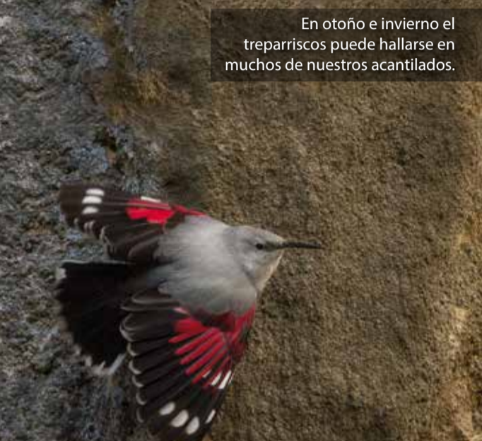
Treparriscos ( Tichodroma muraria )

Las aves esteparias están ampliamente representadas: ganga ibérica, ganga ortega, alcaraván, sisón y todos los alaúridos ibéricos, incluyendo la alondra ricoti, entre muchos otros.