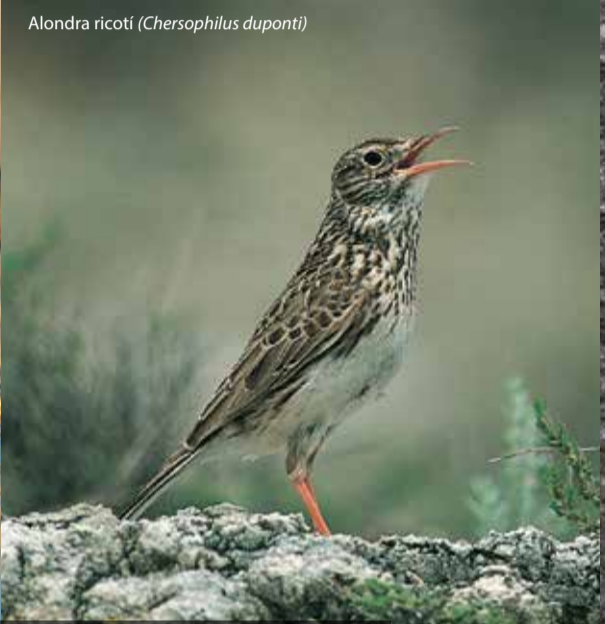
Alondra ricoti ( Chersophilus duponti )

Las aves esteparias están ampliamente representadas: ganga ibérica, ganga ortega, alcaraván, sisón y todos los alaúridos ibéricos, incluyendo la alondra ricoti, entre muchos otros.