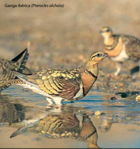
Ganga ibérica ( Pterocles alchata )