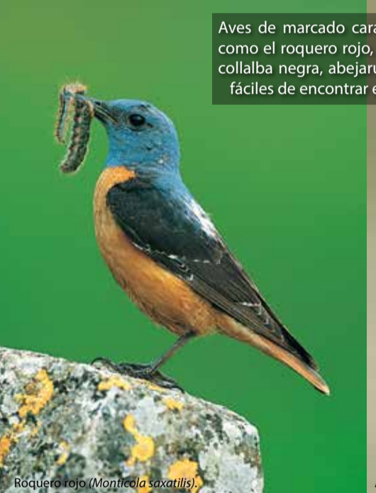
Róquero rojo ( Monticola saxatilis )

En otoño e invierno el treparriscos puede hallarse en muchos de nuestros acantilados.