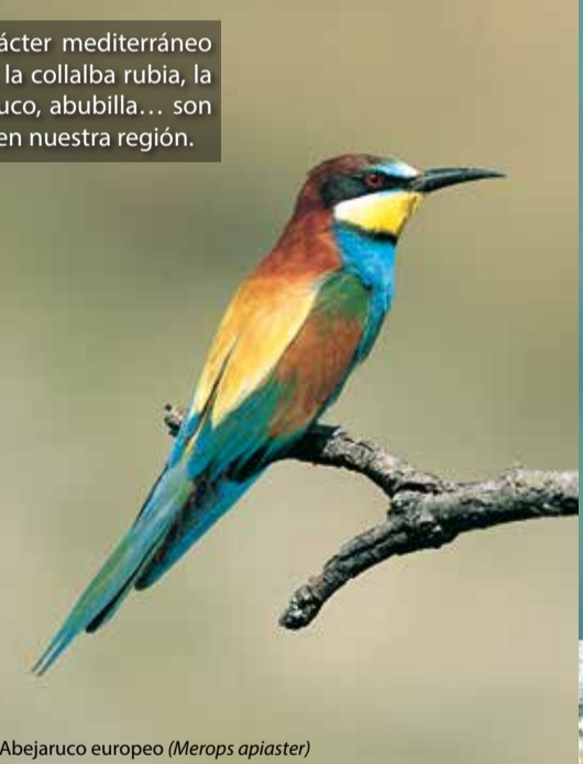
Abejaruco europeo ( Merops apiaster )

Aves de marcado carácter mediterráneo como el roquero rojo, la collalba rubia, la collalba negra, abejaruco, abubilla... son fáciles de encontrar en nuestra región.