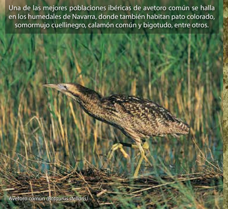
Avetoro común ( Botaurus stellaris )

Los pequeños insectívoros migratorios son una amplia comunidad destacando curruca tomillera, curruca mirlona, mosquitero papialbo, mosquitero ibérico y muchos más.