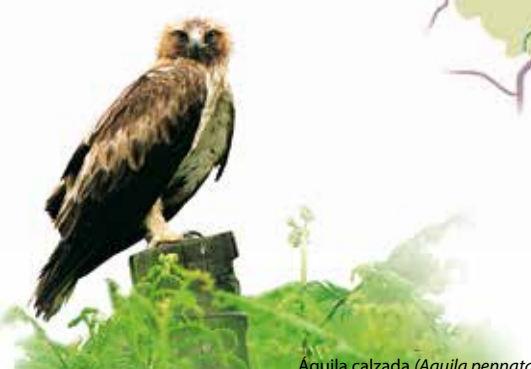
Águila calzada ( Aquila pennata )

Fotografías: Eduardo Ayala, Gorka Gorospe, Luis Otermin, Ricardo Rodríguez, Joseba del Villar. Contenidos y dibujos: Gorka Gorospe Diseño gráfico: Ana Cobo - Oscar Munárriz DL: NA 964-2019 Foto portada: Alimoche común ( Neophron percnopterus ). Autor: Ricardo Rodríguez 12ª edición. Abril 2019