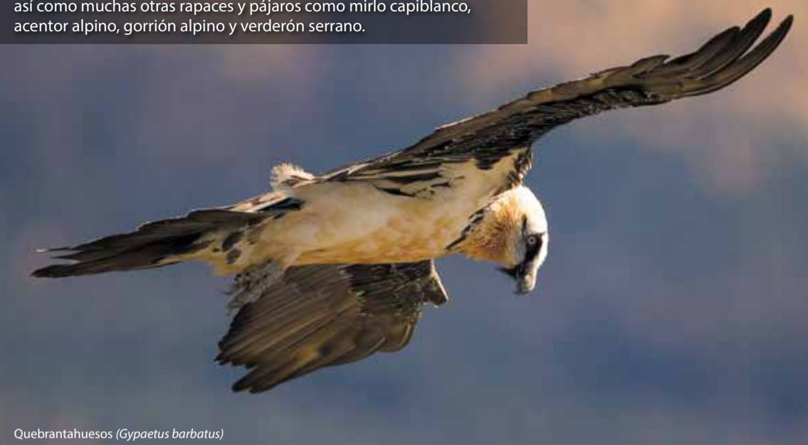
Quebrantahuesos ( Gypaetus barbatus )

En las montañas es posible encontrar al espectacular quebrantahuesos, así como muchas otras rapaces y pájaros como mirlo capiblanco, acentor alpino, gorrión alpino y verderón serrano.