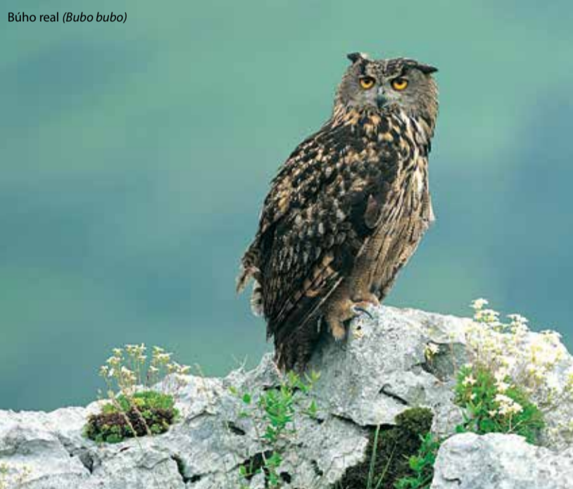
Búho real ( Bubo bubo )