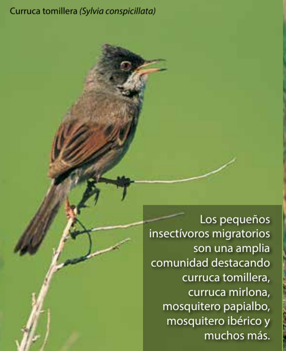
Curruca tomillera ( Sylvia conspicillata )

Los pequeños insectívoros migratorios son una amplia comunidad destacando curruca tomillera, curruca mirlona, mosquitero papialbo, mosquitero ibérico y muchos más.