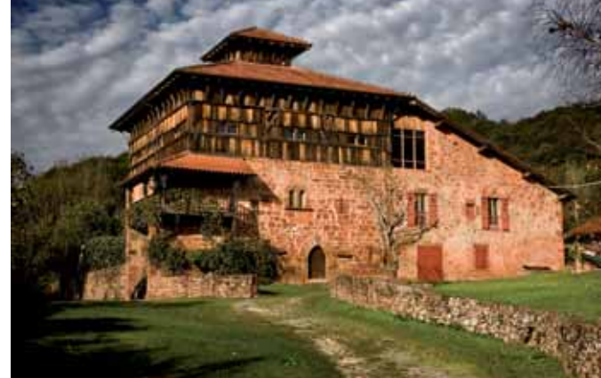
▲ Palacio de Jauregizarrea en Arraioz