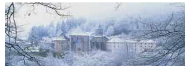
▲ La Colegiata de Orreaga/Roncesvalles