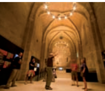
Imágenes captadas en Estella, Olite y durante mercados y fiestas medievales.

(abierta hasta el 30 de septiembre) Paseo zona turística, s/n 31411 Javier Tel.: 948 884387 oit.javier@navarra.es