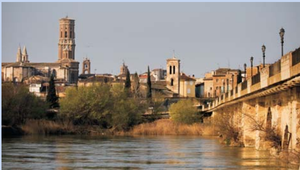
El río Ebro a su paso por Tudela. Al fondo, la Catedral