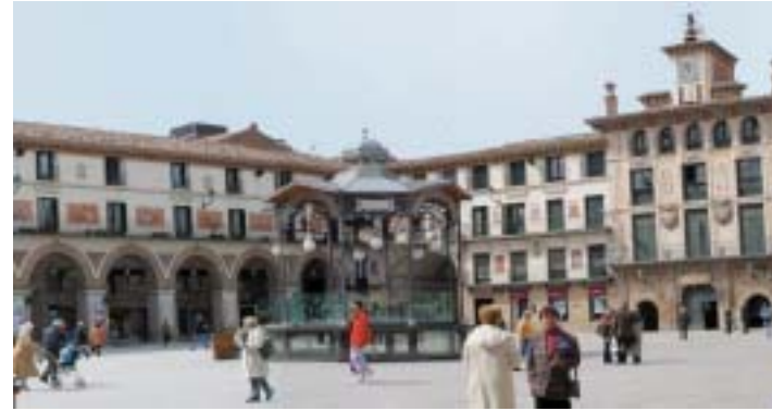
Plaza de los Fueros, centro neurálgico de la ciudad.